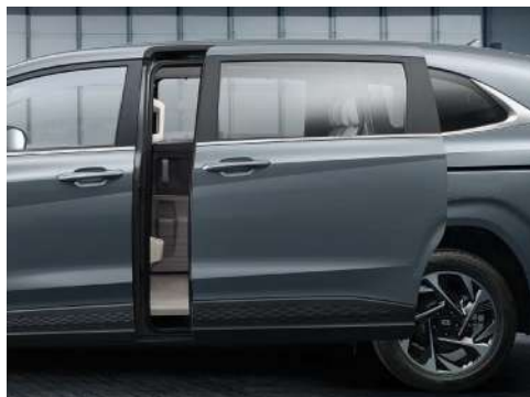
Электржетегі бар жылжымалы есіктер