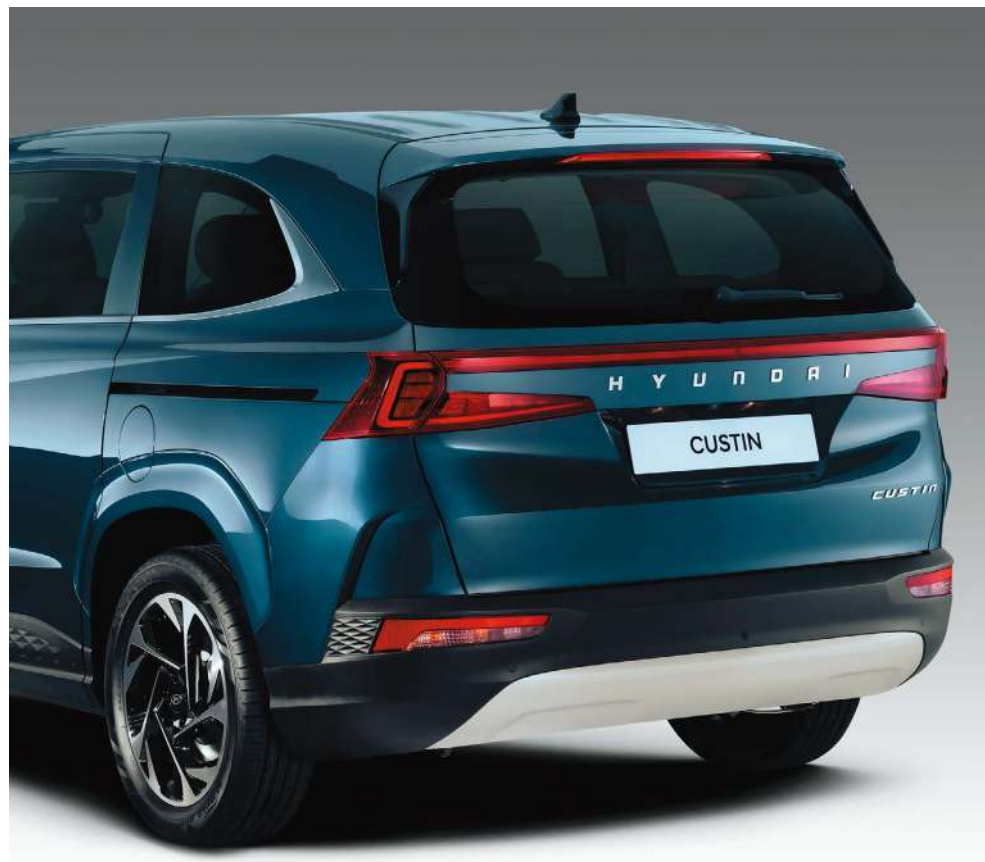
Біріктірілген түрдегі артқы жарықдиодты шамдар