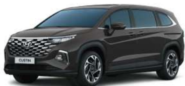
Қоңыр Ebony brown (XM8)