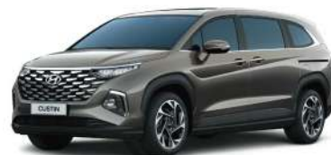
Сұр Military gray (REY)