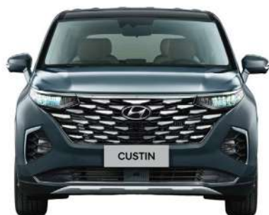
Жалпы ені 1 850 Жолтабан ені 1607/1635