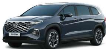
Перламутрлы көк Dark aurora (PK8)