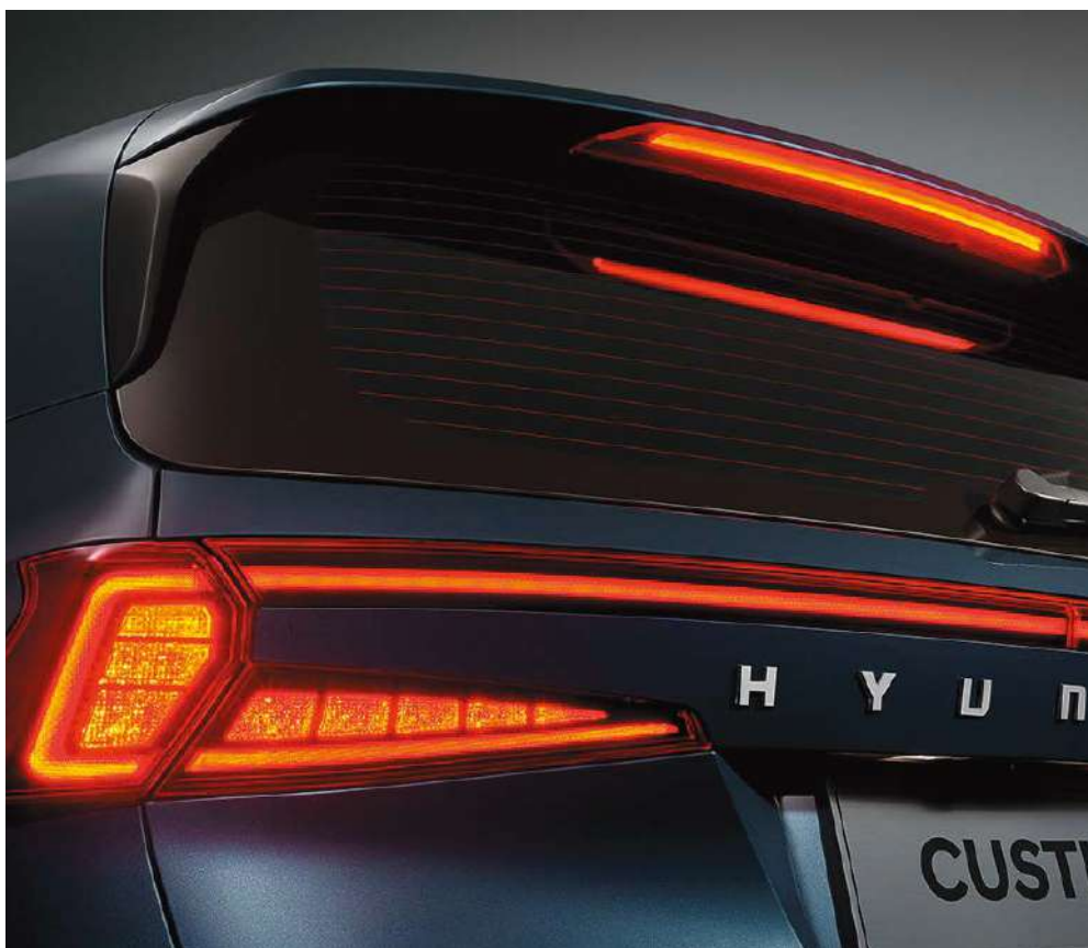
Артқы шамдардың жарықдиодты блогы