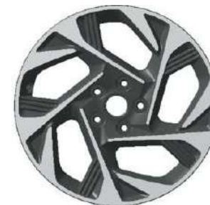
18-дюймдік жеңіл қорытпалы дөңгелек дискілер