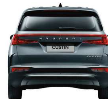
Жолтабан ені 1607/1635