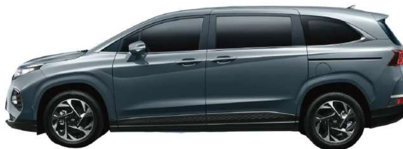
Жалпы ұзындығы 4 965 Дөңгелек базасы 3 055