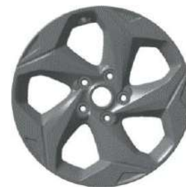
17-дюймдік жеңіл қорытпалы дөңгелек дискілер