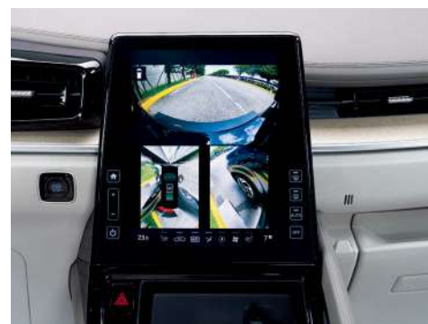
Айнала шолу жүйесі