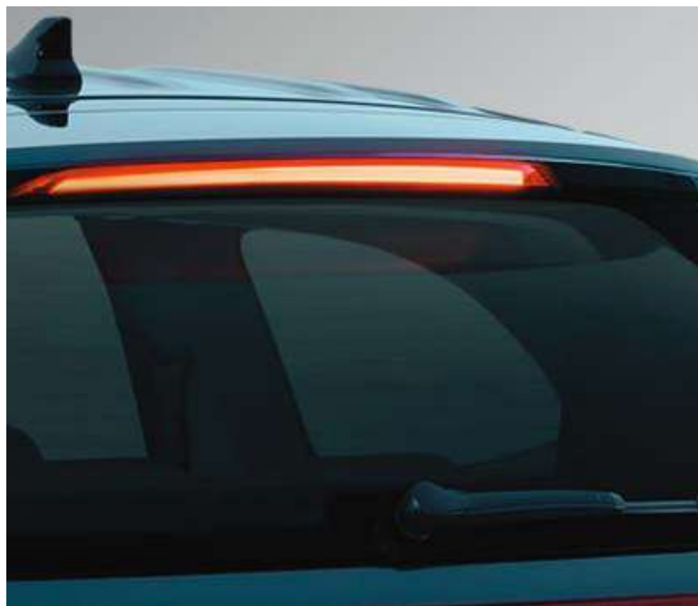
Қосымша тоқтау сигналы бар артқы спойлер