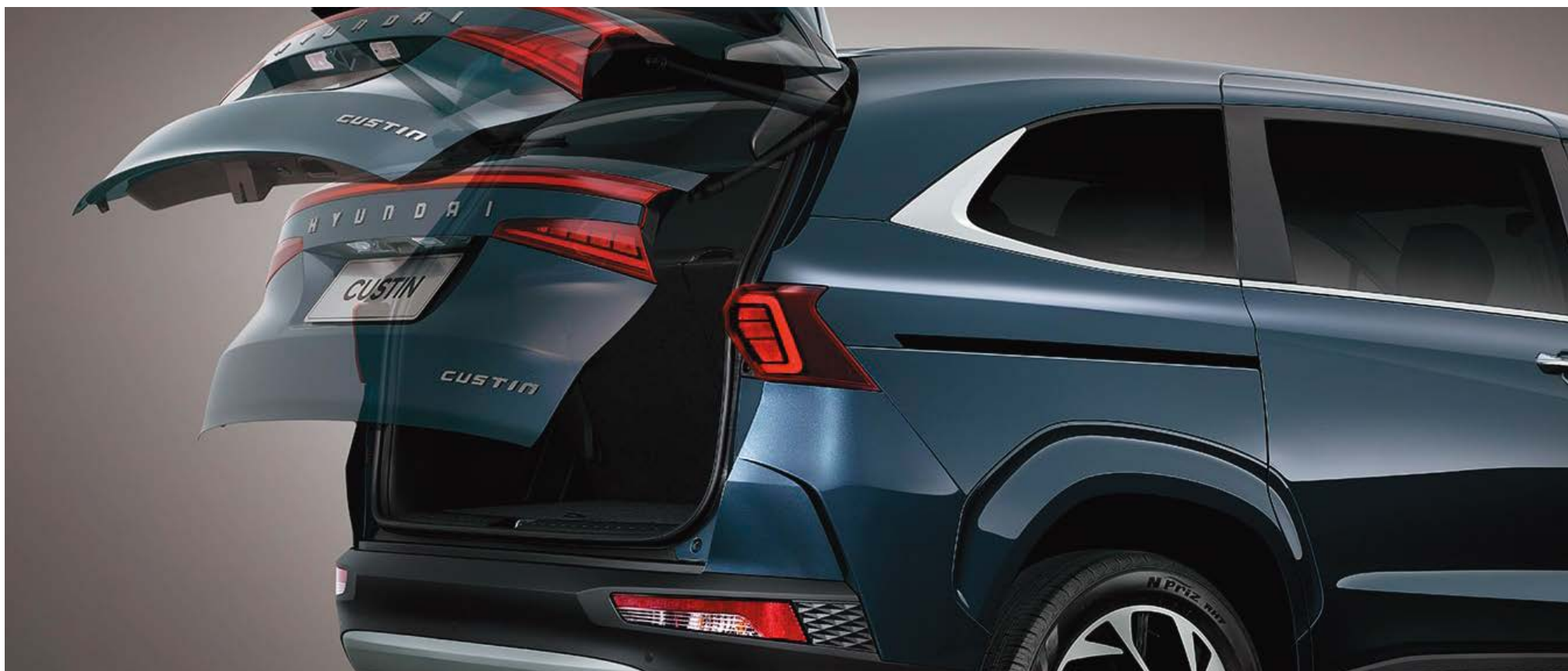
Электржетегі бар жүксалғыш есігі