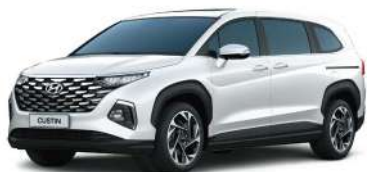
Ақ Crystal White (7F)