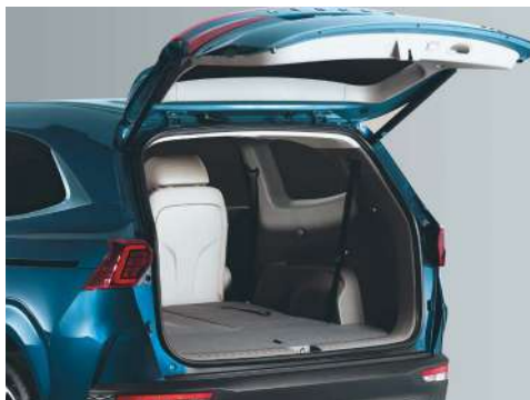
Электржетегі бар жүксалғыш есігі