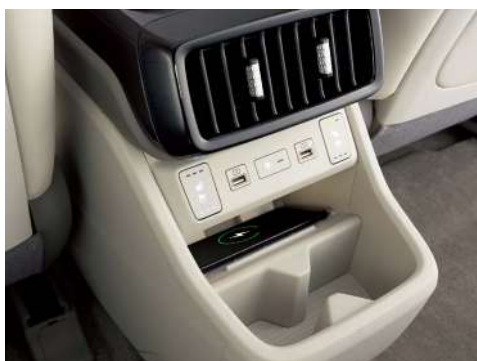
Артқы сымсыз зарядтау құрылғысы