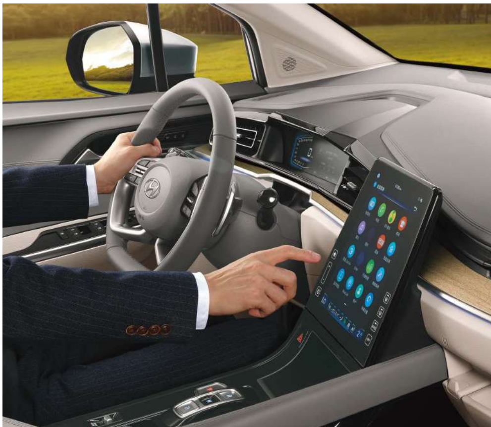
Диагонали 10,4 дюйм орталық экран

Интеллектуалды басқару мүмкіндіктерін пайдаланыңыз, жайлылықтан ләззат алыңыз.