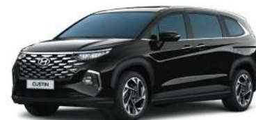
Қара Phantom black (NNB)