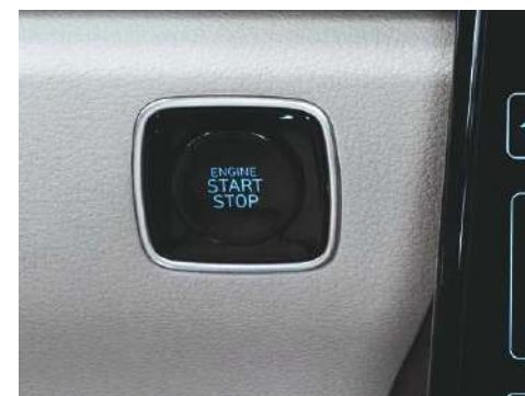
Smart Key Кілсіз ашу жүйесі және қозғалтқышты оталдыру батырмасы