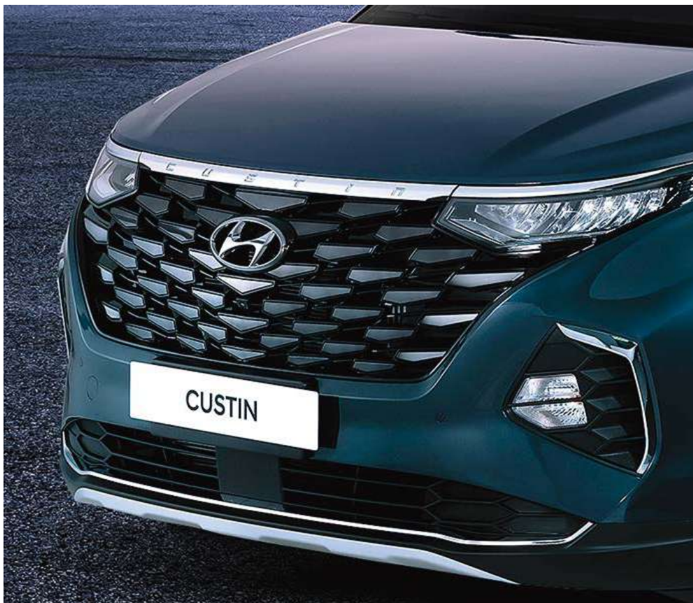
Күндізгі жүріс шамдары (КЖШ) бар ромб түріндегі параметрлік радиатор торы