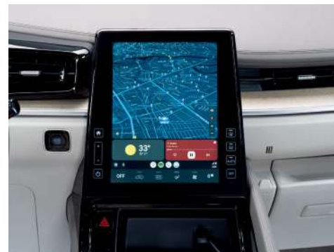
10,4 дюймдік көп функциялы ақпараттық ойын-сауық жүйесі