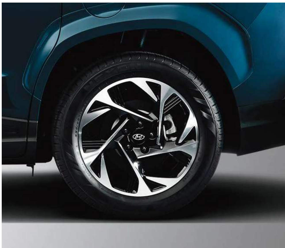
18-дюймдік жеңіл балқығыш дискілер