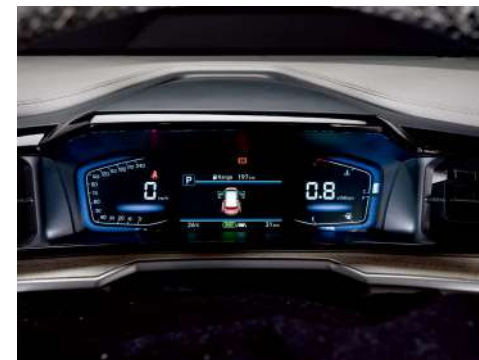
4,2 дюймдік СК-дисплейі бар толығымен цифрлық аспаптар тақтасы