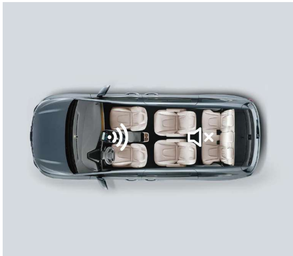
Орындықтардың екінші және үшінші қатарлары үшін дыбысты өшіру

Отбасыңыз сапар кезінде тыныш ұйықтай алу үшін мультимедиялық жүйенің экраны арқылы екінші және үшінші қатардағы дыбысты өшіруге болады.