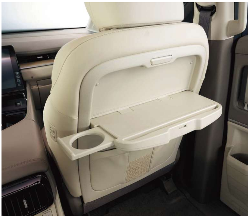
Планшетке арналған тіреуіші бар артқы орындықтағы жиналмалы үстелдер