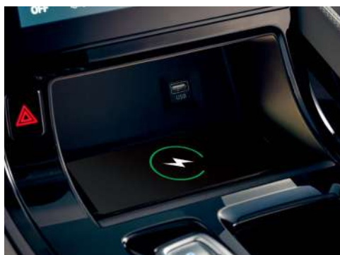
Алдыңғы сымсыз зарядтау құрылғысы